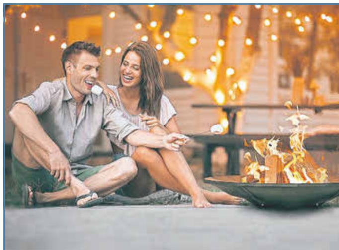
spp-o Foto: Leda Werkspp-o

Wenn die Nacht anbricht, sorgt die Feuerfackel für warmes Licht im Garten. Brennen mehrere gleichzeitig, verbreitet das Lodern der Flammen in der Dunkelheit eine märchenhafte Stimmung.