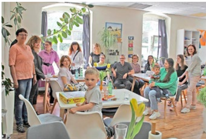
Sprachfeststellung für Ukrainerinnen im Diakonieladen Geben und Nehmen Bad Lobenstein

Um die deutsche Sprache ging es auch beim Aktionstag, der nun im Diakonieladen Geben und Nehmen in Bad Lobenstein stattgefunden hat. Die Volkshochschule Saale-Orla und die Jobmanager hatten eingeladen, um den in der Region lebenden Frauen die Möglichkeit zur Sprachstandsfeststellung zu bieten. „Mehr als 30 Frauen aus Bad Lobenstein, Hirschberg, Friesau, Wurzbach und Lehesten sind der Einladung gefolgt.