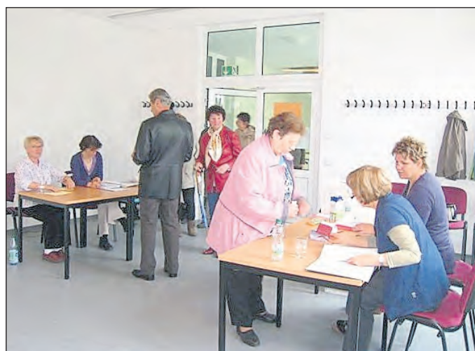
4 der 72 ehrenamtlichen Wahlhelfer bei ihrer Arbeit im FFW-Gerätehaus in Bad Lobenstein

Am 22. April 2012 waren alle Bad Lobensteiner aufgerufen, einen hauptamtlichen Bürgermeister zu wählen.