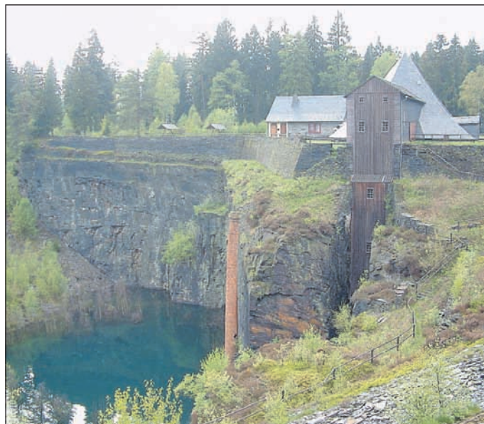
„Staatsbruch bei Lehesten“

Auch aus unserem Naturpark „Thüringer Schiefergebirge/Obere Saale“ sind 2 Naturwunder dabei: Der Bohlen bei Saalfeld und die Schieferbrüche bei Lehesten.