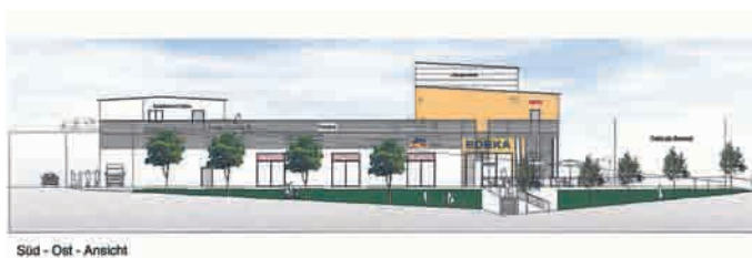
Süd - Ost - Ansicht

Bei der am 28.10. stattgefundenen Sitzung des Bau- und Stadtentwicklungsausschusses ging es neben der Bearbeitung städtebaulicher Anträge um die Vorstellung der Pläne für den beabsichtigten Neubau eines Einkaufszentrums auf dem jetzigen Lob-Kauf-Areal durch die „rebo consult“ als Bauherr mit der Edeka sowie der dm-Drogeriemarktkette und dem NKD als Mieter und Betreiber.