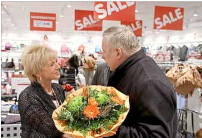
Die Leiterin des NKD-Marktes freut sich über die Blumen und Glückwünsche des Bürgermeisters.