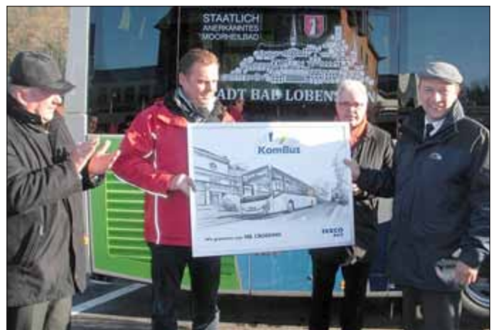
Taufe des 100. Busses der Herstellerfirma Iveco an die KombiBus.