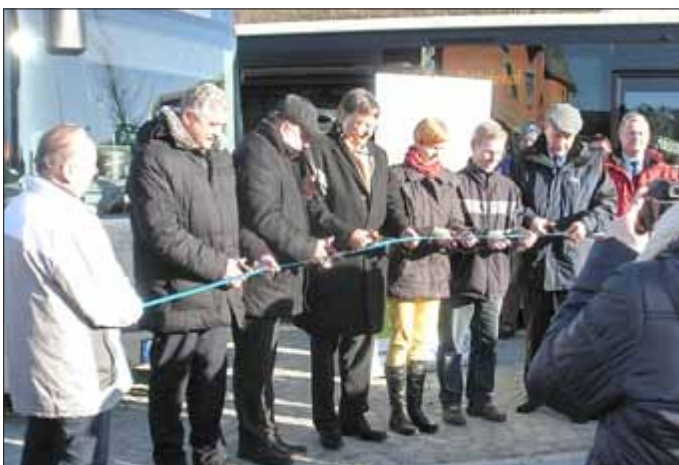
Die offizielle Eröffnung des Busbahnhofes durch Staatssekretär Dr. Sühl, den Bürgermeister und alle beteiligten Firmen .