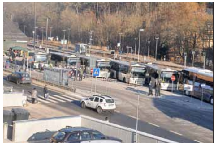
Blick vom Einkaufszentrum zum neuen Bus- Bahn-Verknüpfungspunkt