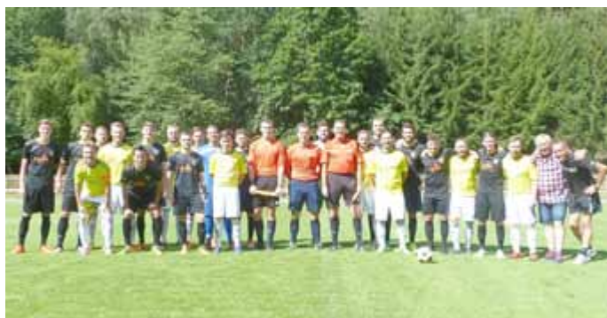
Gruppenbild vor dem Freundschaftsspiel zwischen dem VfR Bad Lobenstein und dem TSV Eltingen