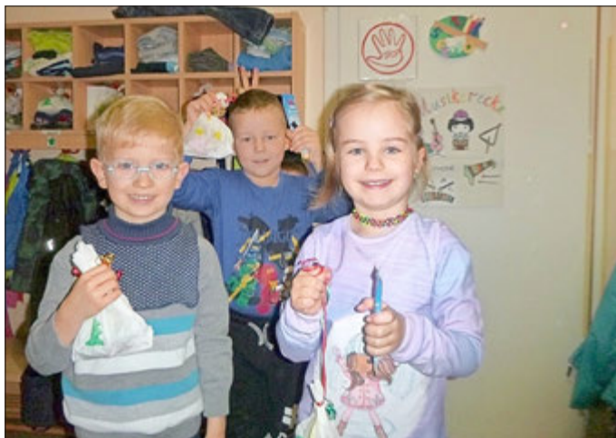
Das Team vom Kindergarten „Sonnenschein“

Die Kinder und das Team bedanken sich ganz herzlich für alle Geld- und Sachspenden, die im Jahr 2020 dem Kindergarten zu Gute gekommen sind und wünschen allen Sponsoren und Familien eine schöne Weihnachtszeit und für das Jahr 2021 alles Gute und vor allem Gesundheit!