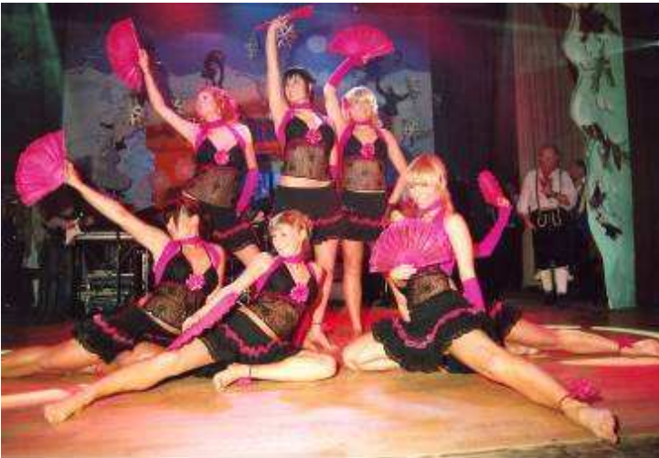
Zur Galaveranstaltung des „KCL Blau-Gold“ am 3. Februar im Kultur-

Närrischer Endspurt in der Stadt und Region