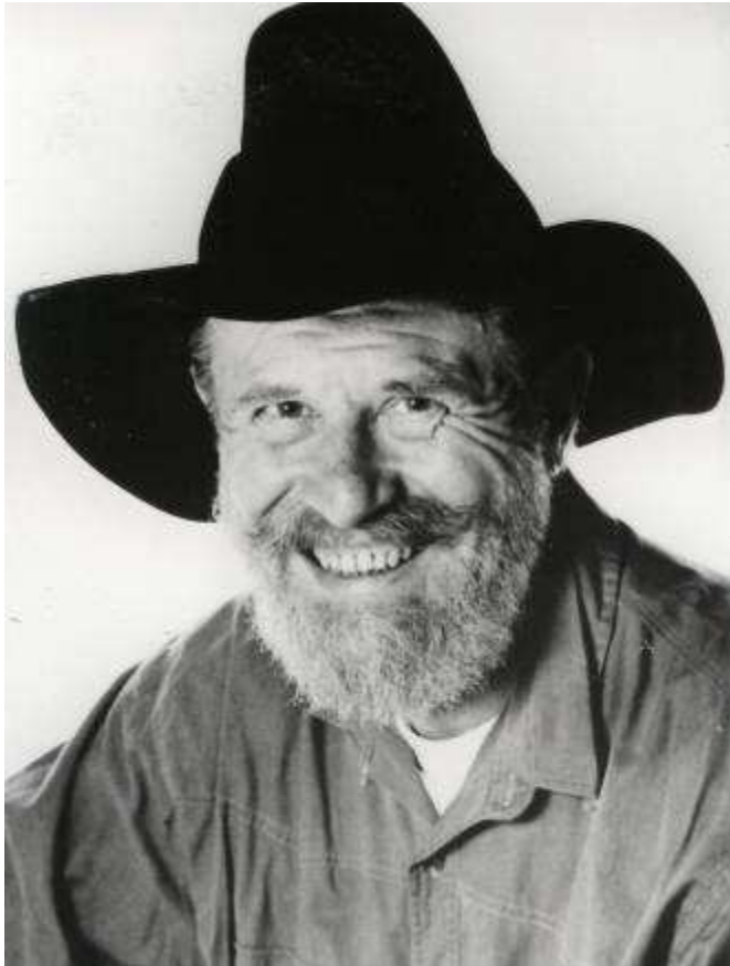
Abenteuer Wildnis – Kanada/Alaska

als Farbdiaschau und Vortrag des Autors.