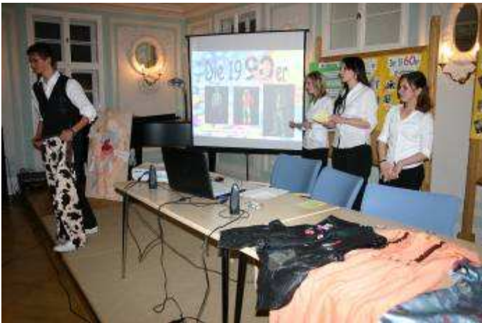
Eindrucksvoll mit passender Musik unterlegt präsentieren Schüler des Reichard-Gymnasiums, wie sich Popmusik und Kleidung seit den 50er Jahren gegenseitig beeinflusst haben.