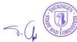
Peter Opperl Bürgermeister