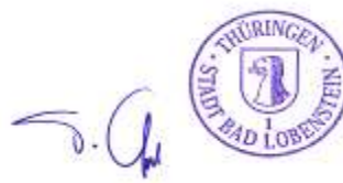
Peter Ooppel Bürgermeister