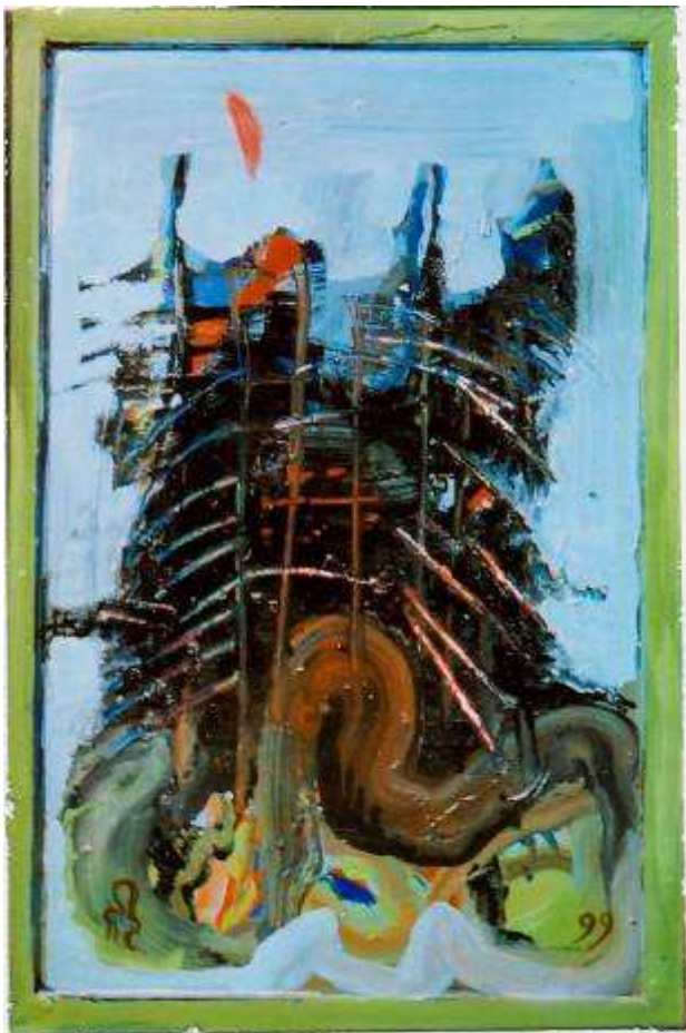
Rainer Zille: Utah Gebirge

Die Auswahl der Bilder zeigt dem Besucher die unterschiedliche Herangehensweise des Künstlers, seine Eindrücke in der jeweiligen Landschaft aufs Papier oder die Leinwand zu bannen. Manchmal schien ihm eine flüchtige Zeichnung zu genügen, um die besondere Atmosphäre des Ortes festzuhalten – dann wieder brauchte er den Duktus und den Reiz der Farbe, dass Erlebte zu gestalten und oft auch durch mehrmaliges Übermalen zu „Ideenlandschaften“ zu verdichten.