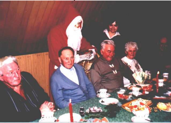
Den Senioren im Ortsteil Helmsgrün stattete sogar der Weihnachtsmann einen Besuch ab.

Die Geselligkeit, das sich Treffen und miteinander Reden ist das Wichtigste einer solchen Veranstaltung, wobei es unsere Senioren im besonderen Maße verdient haben, dass an sie gedacht wird.