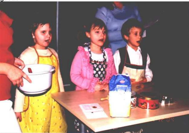
Kinder beim Vorführen der „Weihnachtsbäckerei“ zur Seniorenweihnachtsfeier in Oberlemnitz

Die Geselligkeit, das sich Treffen und miteinander Reden ist das Wichtigste einer solchen Veranstaltung, wobei es unsere Senioren im besonderen Maße verdient haben, dass an sie gedacht wird.