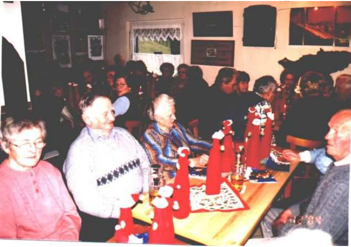
In Lichtenbrunn fand die Weihnachtsfeier der Senioren und Vorrüheständler im „Country-Club“ statt.