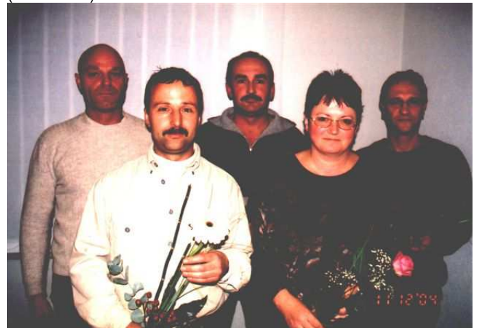
Der neue Bürgerrat von Unterlemnitz (v.l.n.r.)

Der bisherige Bürgerrat wurde mit Dank verabschiedet und von den anwesenden Einwohnern ein neues Ortsgremium gewählt (siehe Foto).