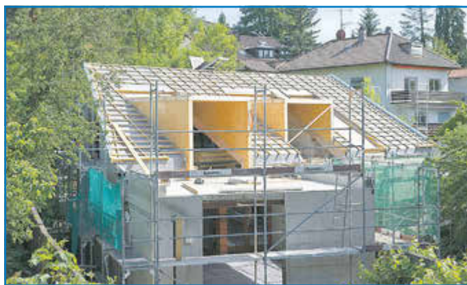
Das energetische Sanieren an sich ist bereits nachhaltig, da der Heizwärmebedarf des Gebäudes und damit die CO 2 -Emissionen verringert werden. HLC

Je niedriger der Wärmebedarf des Gebäudes und die benötigten Vorlauftemperaturen sind, umso wirtschaftlicher und effizienter können Wärmepumpen betrieben werden.