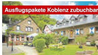
Ausflugs Pakete Koblenz zubuchbar