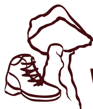
Ausblick Gelersteine-Tour

Tourist-Info-Zentrum Pfälzerwald Schuhmeile 1 · 76846 Hauenstein · Tel. 06392 9233380 www.urlaubsregion-hauenstein.de