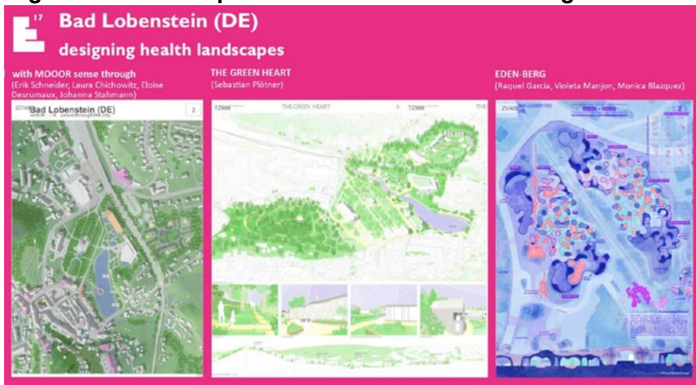
(Grafik: Darstellung von Wettbewerbsausschnitten der drei Preisträger)

Am 27. März 2023 startete europaweit offiziell der städtebauliche EUROPAN-Ideenwettbewerb (E17), zu welchem die Kurstadt einer von 55 ausgewählten Städten in Europa ist.