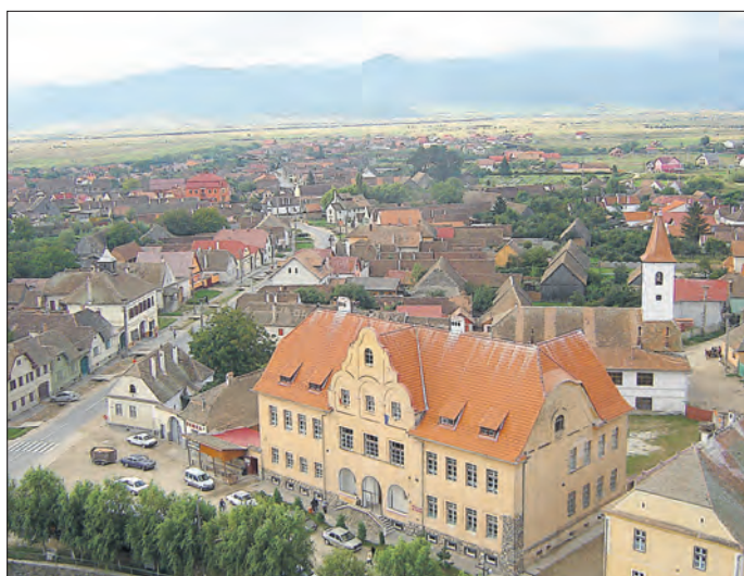
Blick auf Großau am Fuße der Karpaten

Bad Lobenstein. „Impressionen aus Siebenbürgen“ nennt sich ein Diavortrag, welcher am Freitag, dem 9. März, um 19 Uhr , im „Neuen Schloss“ Bad Lobenstein beginnt. Roland Barwinsky stellt dann diesen kulturgeschichtlich hochinteressanten Teil des Balkans und einige seiner Bewohner ausführlich vor. Reflektiert werden von dem Autor dabei auch außergewöhnliche Erlebnisse seiner seit Jahrzehnten andauernden Reisetätigkeit durch dieses Gebiet.