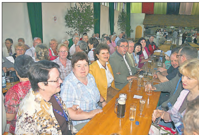
Vier Tage wurde gefeiert und geschunkelt. Mit dabei viele gute Freunde aus dem Partnerschaftsor Pretzier in Sachsen-Anhalt