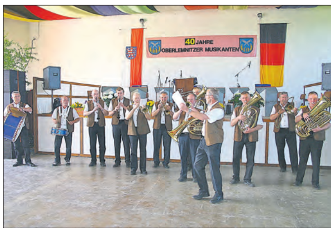
Die „Oberlemnitzer Musikanten“ beim Einmarsch vor dem Festkonzert.

Über 40 Jahre eine Blaskapelle mit Proben, Veranstaltungsorganisation, Spielterminen, Mitgliederwechsel, Technik, Finanzen, Werbung und vielem anderen mehr am Laufen zu halten, ist eine großartige Leistung. Alle 5 Jahre mit den Blasmusikfans und befreundeten Kapellen ein Blasmusikfest zu feiern, ist ebenso großartig und eine Herausforderung für den gesamten Ort, die Agrar Genossenschaft und alle Freunde und Verwandten, die hinter den Musikern stehen. Bei aller Arbeit und manchmal auch Stress sind es jedoch die vielen schönen Stunden und Erlebnisse beim gemeinsamen Musizieren, die herzliche Resonanz des Publikums und die treuen Blasmusikfreunde, die dieses Hobby auszeichnet. Zum Festkonzert am 20. Mai überreichte der Bürgermeister mit einer kleinen Zuwendung die folgende Urkunde: