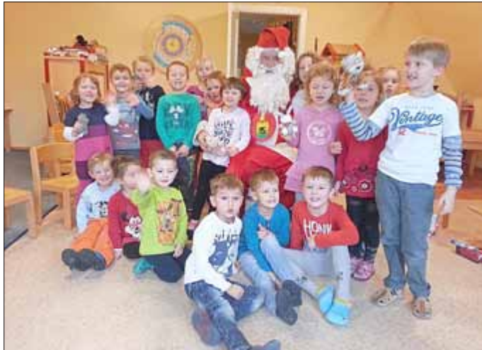
Das Team des Kindergarten „Rappelkiste“

Wir danken bei dieser Gelegenheit allen für die angenehme Zusammenarbeit, für vielfältige persönliche Unterstützung, für Geld- und Sachspenden, die rege Teilnahme an unseren Kindergartenveranstaltungen und vor allem für die große Wertschätzung unserer Arbeit im Kindergartenjahr 2015.