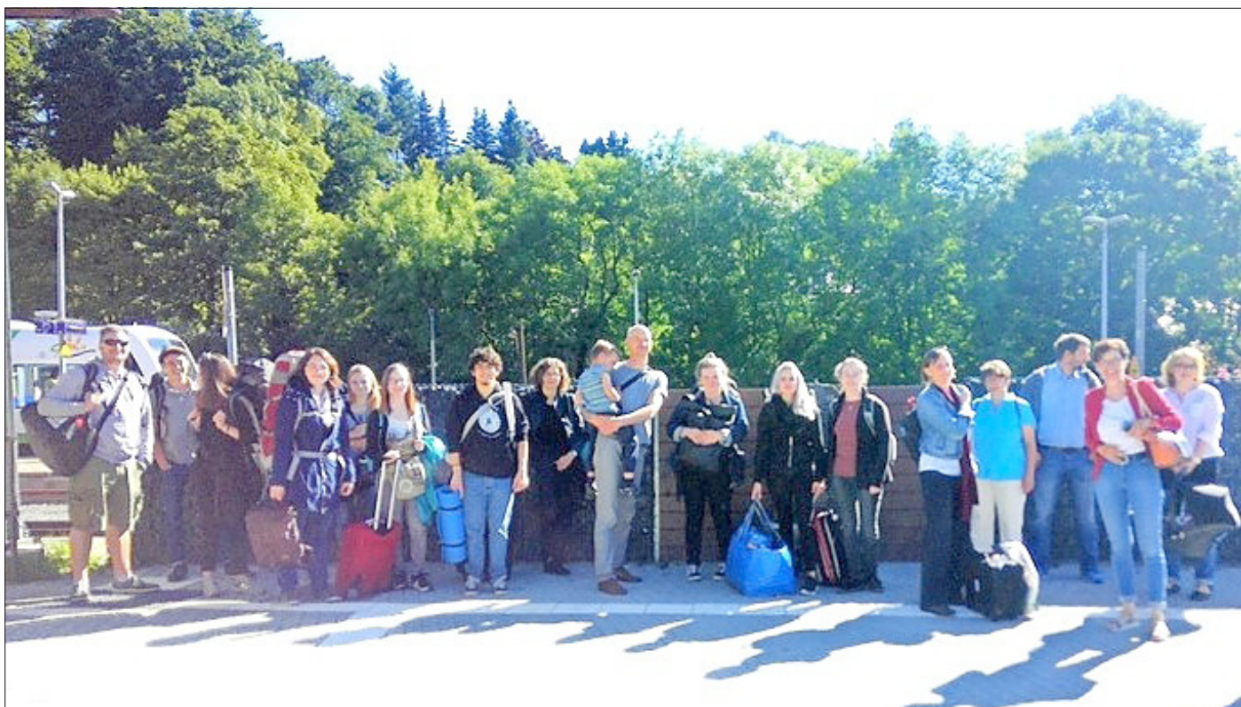
Ankunft der Studenten am Bahnhof in Bad Lobenstein

Nachdem bereits ein Teil des intensiven Stadtentwicklungsprozesses in den letzten beiden Jahren mit Szenario-Werkstätten, JugendBarCamp, Berichterstattungen sowie den ersten zwei Bürgerdialogen und einem Öffentlichkeitsmodul durchgeführt wurde, stellte die „SummerSchool“ 2017 den nächsten Prozess-Höhepunkt dar. Dazu weilten 25 Studierende der Fachhochschulen Erfurt und Aachen aus den Fachbereichen Stadt- und Regionalplanung, Architektur und Landschaftsarchitektur vom 13. bis 18. August 2017 in Bad Lobenstein, um die zukünftig geplante „Grüne Achse“ im Süden der Stadt zu konkretisieren, Ideen zu entwickeln und Lösungsvorschläge zu erarbeiten. Handlungsschwerpunkte liegen hier in der Revitalisierung von Leerstand und Brachflächen, Nachverdichtung, energieeffizientem Wohnungsbau, Freiraumgestaltung und Schärfung des Wegekonzpts in das landschaftlich reizvolle Koseltal sowie die Verknüpfung zweier städtischer Zentren.