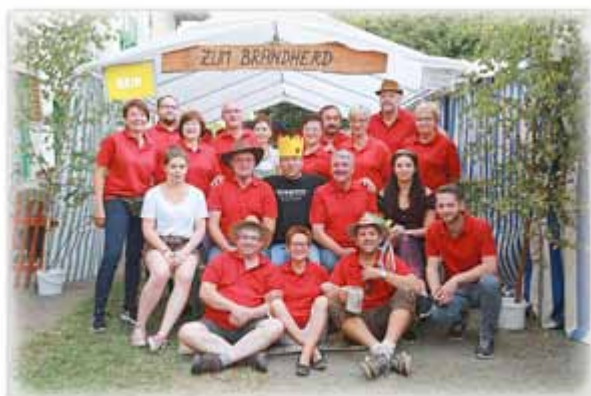
Hainer Kirmesgesellschaft 2016

Die Hainer Kirmesgesellschaft lädt vom 1.9. bis 3.9.2017 auf dem Gelände der Adolf-Diesterweg-Schule im Hain zur „13. Hainer Kirmes“ ein.